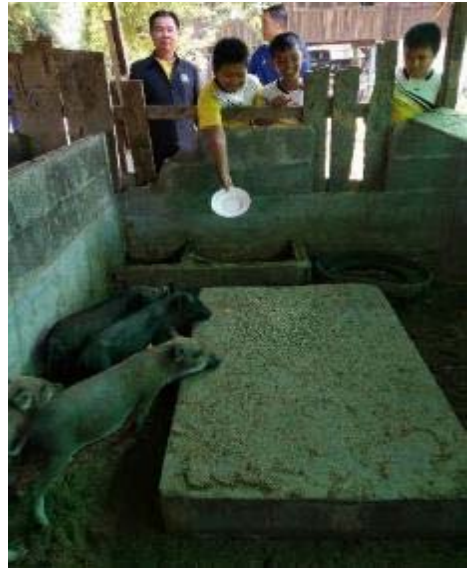
一緒に豚にエサをあげています。