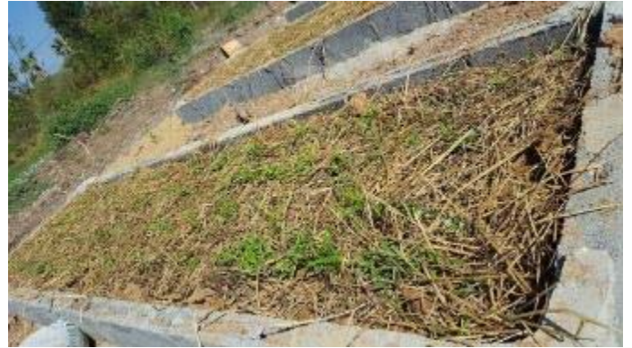
2週間後野菜が発芽しはじめます。