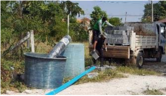
菜園と関係システムの用意