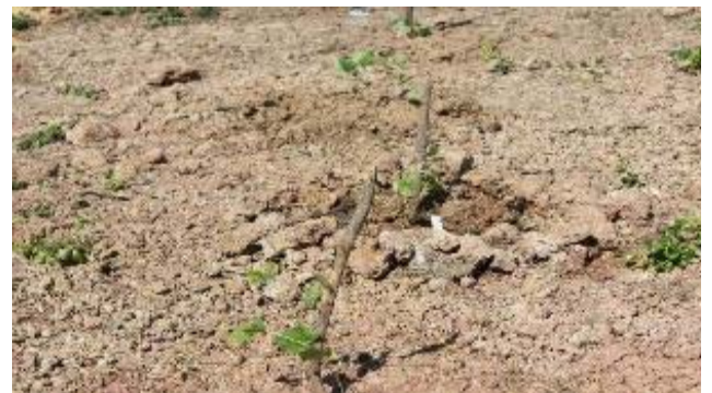
2週間後四角豆が成長しています。