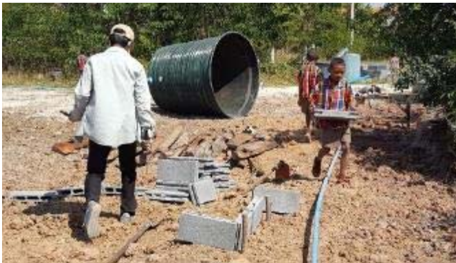
子どもたちも手伝っています。