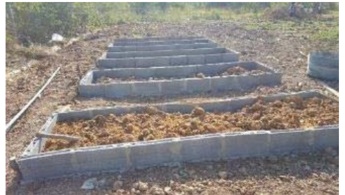
完全になった菜園