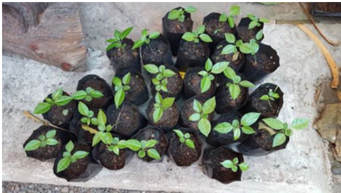
菜園に植えるパッションフルーツの苗木