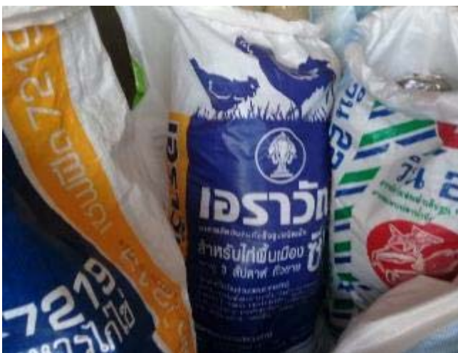
購入した鶏と豚のエサ