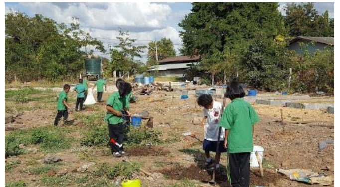
パッションフルーツを植えます。