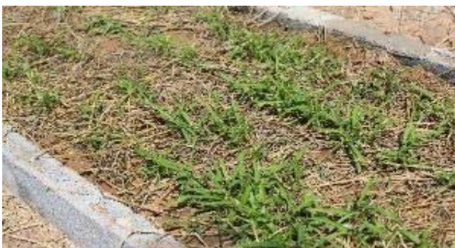
2週間後空芯菜が発芽しはじめます。