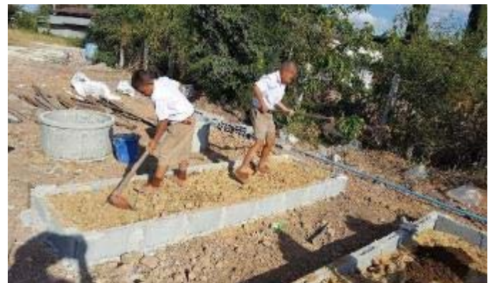
菜園に使用する土の準備