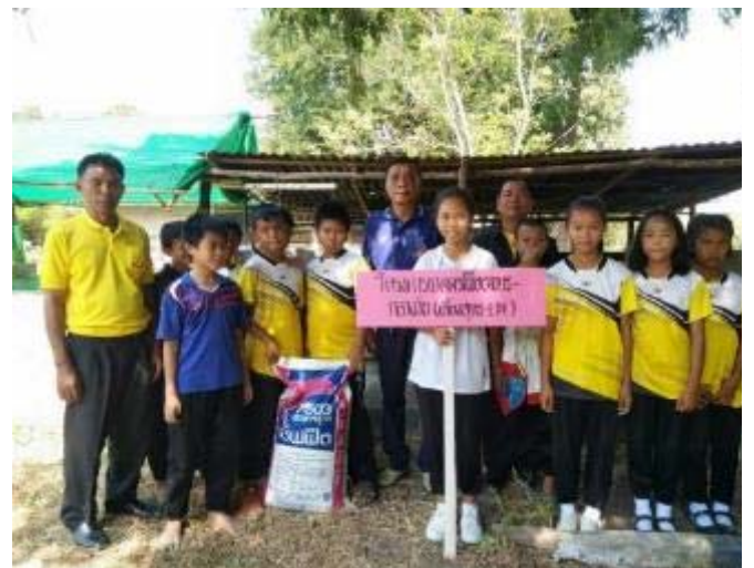
豚小屋の前で担当先生と学生の集合写真