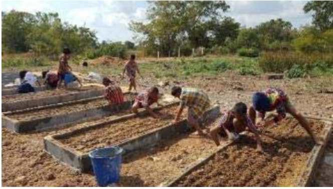
学生全員一緒に野菜を植えます。