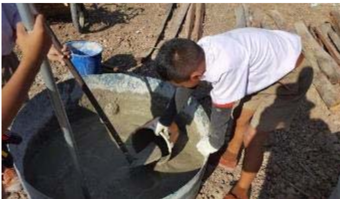
貯水タンクを作っています。