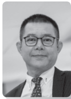
EDF 財団 代表取締役