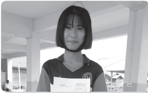
ナッチダー ロイエット県、中学3年分の奨学金を受給

今回2022年の奨学金を支給されることになった4人の子供達からの御礼のメッセージが届きましたので下記の通りご紹介します。